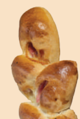
ベーコンフランス

この道37年のパン職人がつくる「ボン・グウ」のパン。「カルデラ食パン」は卵不使用で、耳まで柔らかくお子様からも人気の逸品。一番人気の「塩クロワッサン」は、表面バリッパリ・中はしっとりとした食感が特徴的。程よい塩加減がやみつきに。