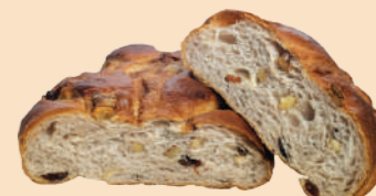
くるみとぶどうのパン