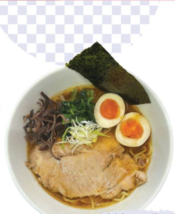
痺辛魚みそ豚骨らーめん